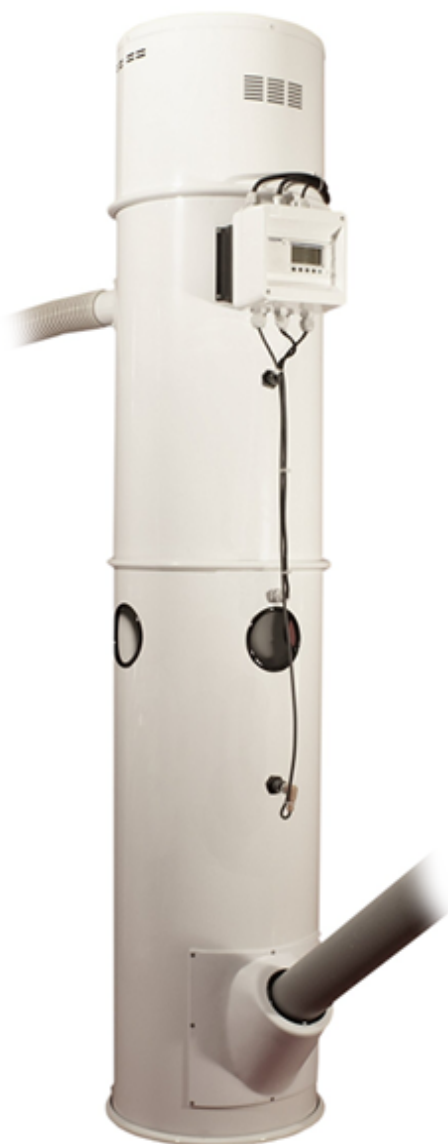
Doserskruv för vakuumenhet