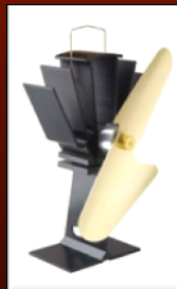
Modell 800 Liten vanlig