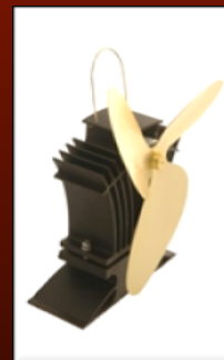
Modell 806 För lägre temperatur